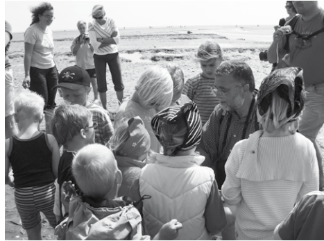
Das „Rohmaterial“ für ihre Bastelarbeiten finden die Kinder im Watt

Naturerlebnis, Basteln und Lernen verbindet die Kreativ-Wattführung“. Montag um 12:30 Uhr ziehen Eltern und Kinder vom